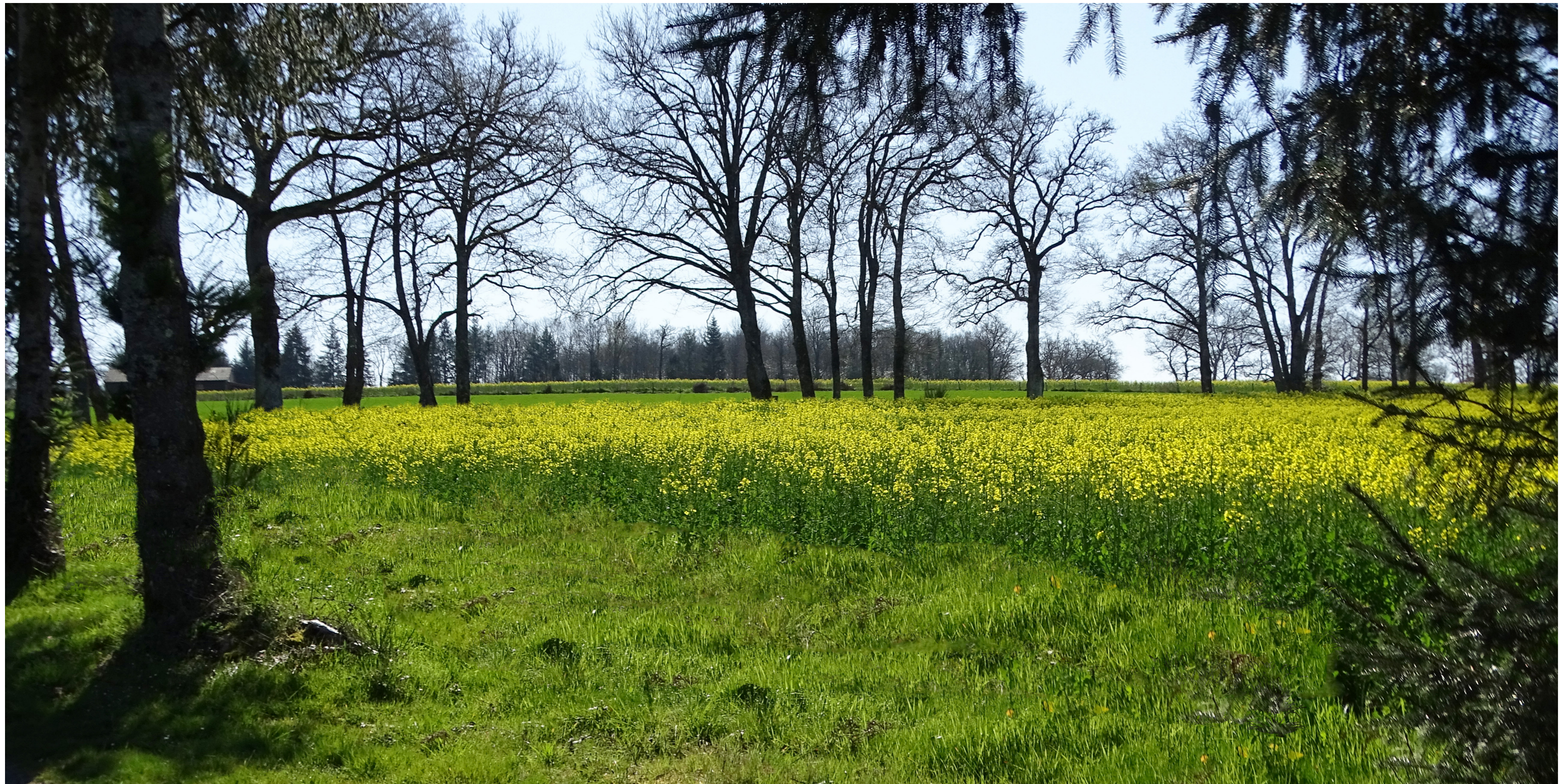
PV1 - Point de vue depuis le nord du projet, au lieu dit «Fond du Breuil»