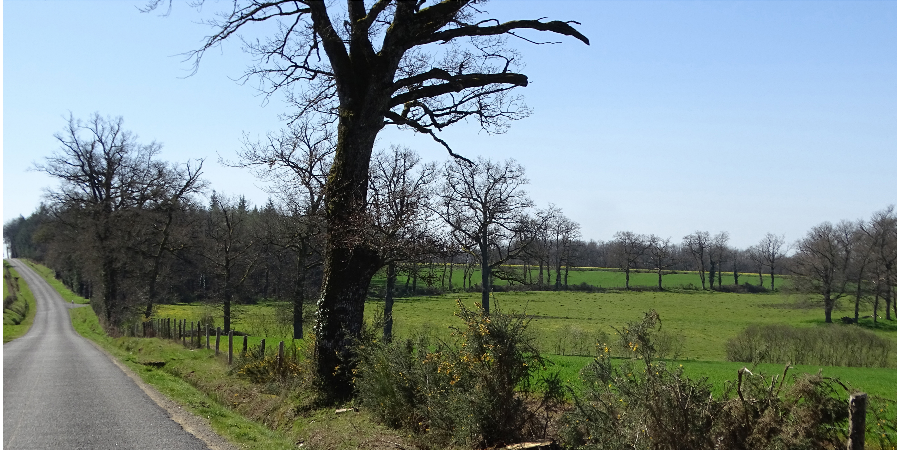
PV2 - Point de vue depuis le nord du projet sur la RD 128