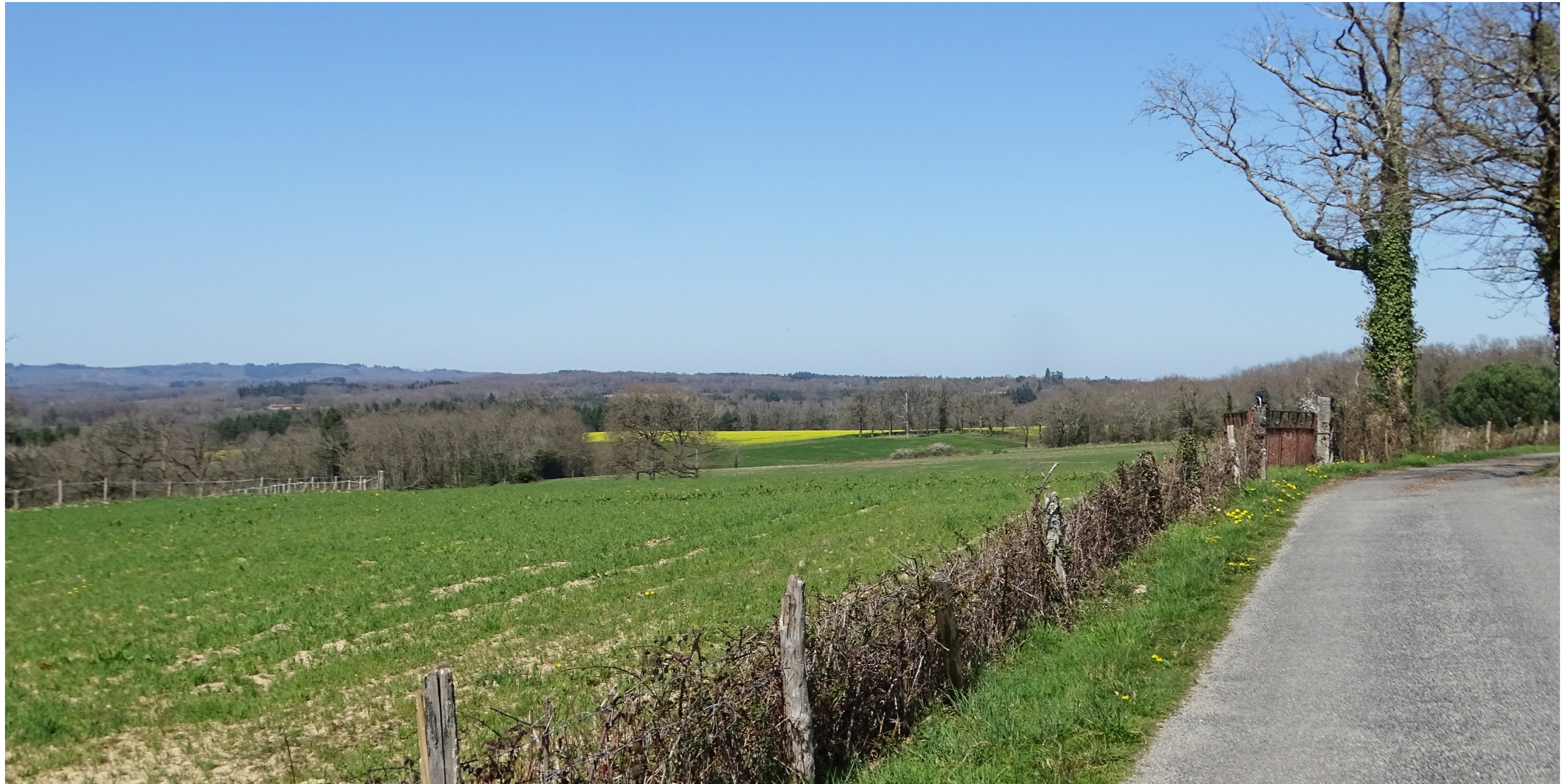
PV3 - Point de vue depuis le sud du projet, au lieu dit «les Palins» - sans mesures paysagères