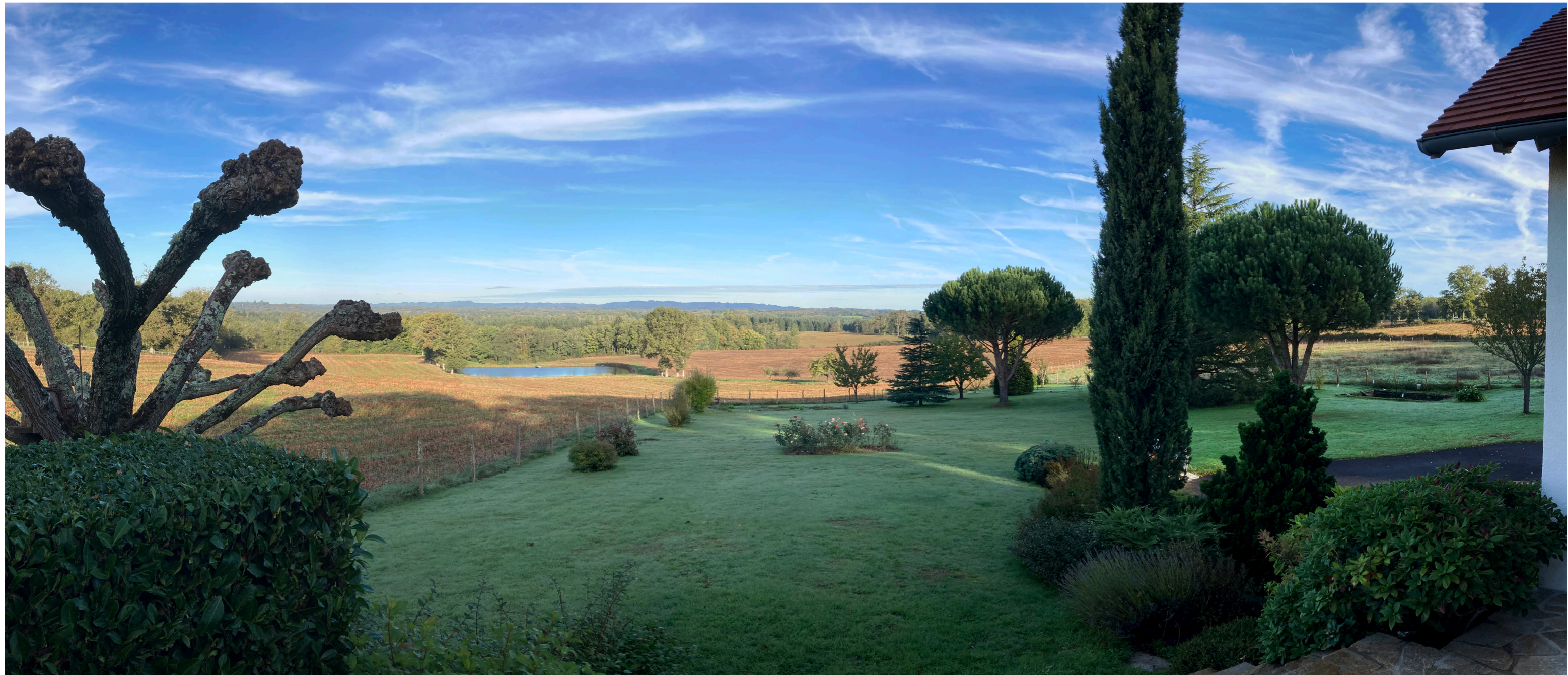
PV5 - Point de vue depuis le sud du projet, depuis la «maison Delhoume»