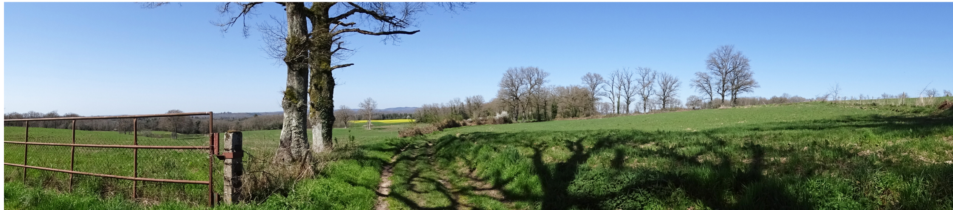
PV4 - Point de vue depuis le sud du projet